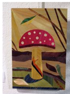
Champignon Michel Maison