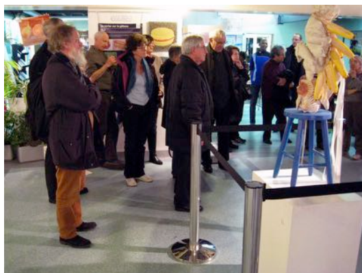
Vernissage le 9 mars 2016