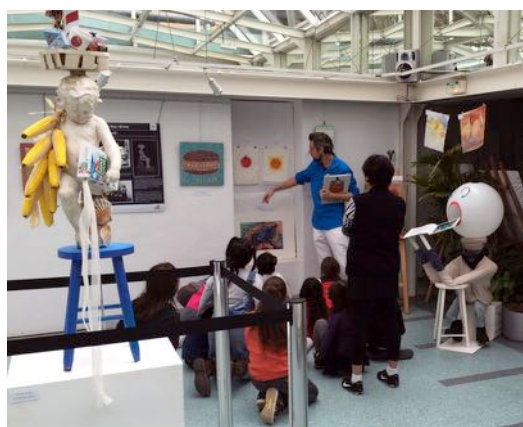
La visite d'une classe