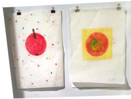
Partage Pomme Yvonne Rego