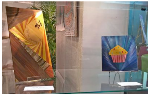
Tablette de chocolat Le cup cake Cécile Fourès Claudine Boisjou