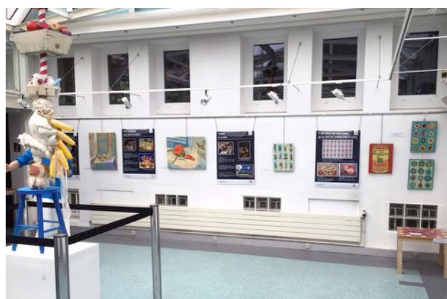
Vue sur une partie des panneaux pédagogiques